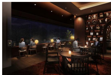
「エピローグラウンジ」イメージ

旅のひとときを手紙で綴る「旅レター」の体験、思い出に浸れる空間「エピローグラウンジ」を設けました。富山で生まれたぬくもりある家具に囲まれながら、1年後に手紙が届く「うなづき未来レター」や「富山もよう」のポストカードで、旅先から大切な人や、未来の自分に手紙をしたためてみてはいかがでしょうか。