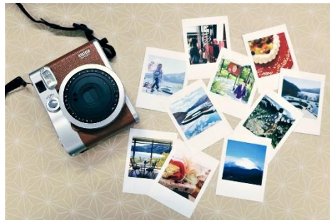
“チェキ”で切り取った旅の思い出イメージ

レトロかわいい「チェキ」で切り取るフォトジェニックな箱根旅。水盤テラスをはじめとした、写真映えるスポットが点在する「はなをり」ならではの滞在プランです。旅のひとときを切り取り、世界に一つだけの思い出のミニアルバムを完成させてみませんか。