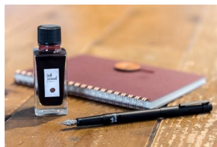
特典のインク&万年筆&トラベルノート

東京・蔵前の文具店「カキモリ」、函館のローカルマガジン「peeps hakodate（ピープス はこだて）」とのコラボレーション企画。函館をイメージしたセピア色のオリジナルインクと万年筆、トラベルノートを手手に、ノスタルジックな函館の街の散策や文具雑貨店をめぐってみませんか。