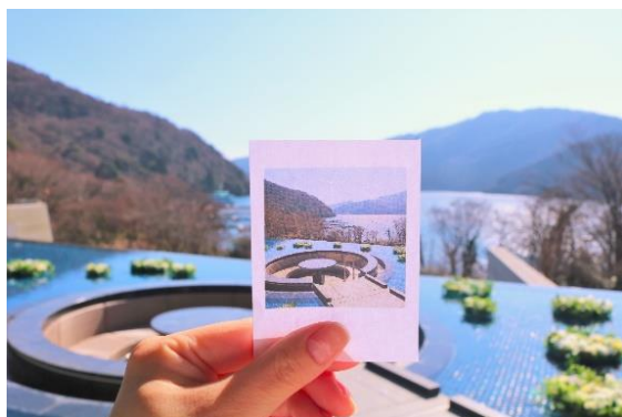
はなをりフォトジェニック旅イメージ